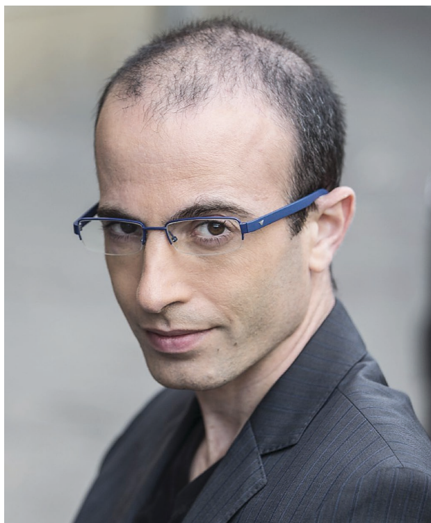
▶ BORZOLJA A KEDÉLYEKET – YUVAL NOAH HARARI

Harari 2014-ben robbant be a tudománynépszerűsítő közéletbe. Sapiens című könyve megjelentetésével – amely több mint tizenötmillió példányban kelt el, és eddig negyvenöt nyelvre fordították le – egy csapásra népszerű public intellectual lépett elő, aki azóta is népszerű előadónként járja a világot (2018-ban például a davosi Világgazdasági Fórumra is meghívták). Kultikus könyve a világtörténelemről ad nagy ívű áttekintést ( big history ). A műfaj persze nem az ő találmánya. Mestereitől főként abban különbözik, hogy az emberiség kialakulása és kulturális fejlődése terén nem csupán a biológiának ( Frans de Waal ) vagy a földrajzi környezetnek ( Jared Diamond ) tulajdonít jelentőséget, hanem ( Francis Fukuyamához hasonlóan) a „tör- ▶▶