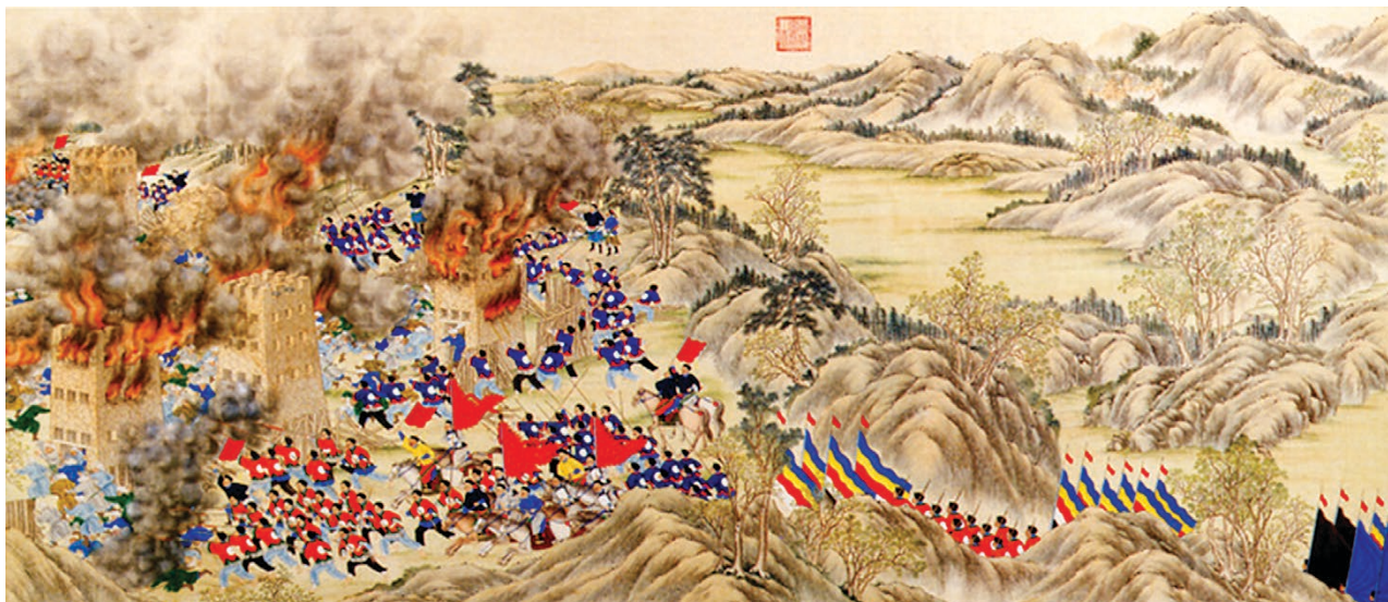
► A TAJPING-FELKELÉS ÓVATOSAN IS HÜSZMILLIÓRA BECSÜLT EMBERÁLDOZATÁNAK TÚLNYOMÓ RÉSE CIVIL VOLT

lan”, hogy megóvja magát a felgyorsult világ destabilizáló hatásaitól. Ez történt a XIX. században is. Az ipari forradalom kitörésére az egyik jellemző reakció a vallási fanatizmus ébredése volt, amely akkoriban hatalmas hullámban vonult végig az egész világon. Az intellektuális becsületesség azt kívánja, hogy ezen a ponton utaljunk a katolikus egyház reakciójára is: Európában a XIX. század közepén a munkásmozgalom terjedésétől, az abszolutista monarchiák megrendülésétől, valamint a pápai állam bukásától traumatizált egyház történelmének talán legreakciósabb, fundamentalista időszakát élte. 1870 (Róma elfoglalása) és 1929 (a lateráni szerződés) között a pápák önkéntes fogóságba vonultak vissza a Vatikán falai mögé, és nagyjából válogatás nélkül elítélték a modern világ valamennyi új jelenségét (a kommunizmust, a demokráciát, a lelkiismereti és vallásszabadságot, a történetkritikai módszert stb.). A Biblia fundamentalista olvasatát képviselő újszolasztikus teológia a tanítóhivatal hivatalos teológiájává lépett elő, és azt a benyomást igyekezett kelteni, hogy zsebében van a válasz a modernitás korszakának valamennyi problémájára.